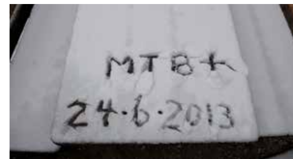
Dat verwacht je niet...