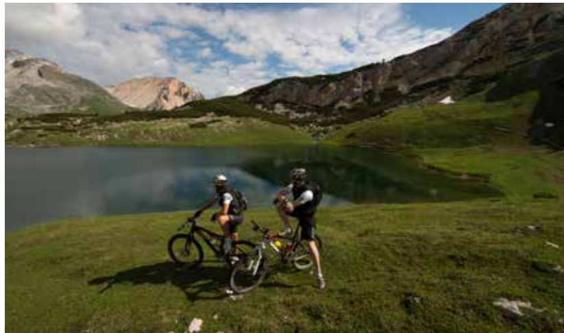
Genieten bij de Limo-see op de top van de Limojoch

Ploeterend op de pedalen, soms lopend door restanten sneeuw wordt het afzien bergop beloond met fantastische uitzichten.