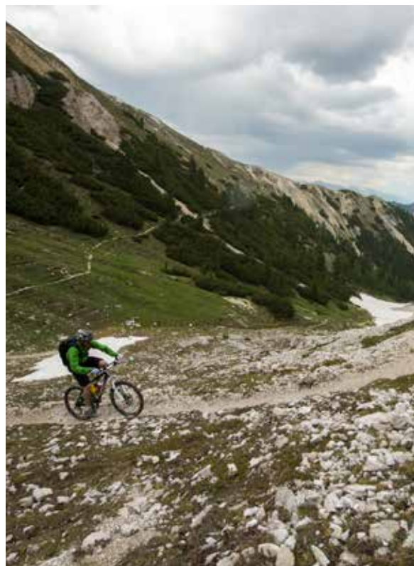
Trails en steile beklimmingen in overvloed!

ongeveer twaalfhonderd hoogtemeters hoger, naar de top van de Kronplatz. Een fantastisch panoramisch uitzicht over half Südtirol is de beloning voor helemaal niets te doen.