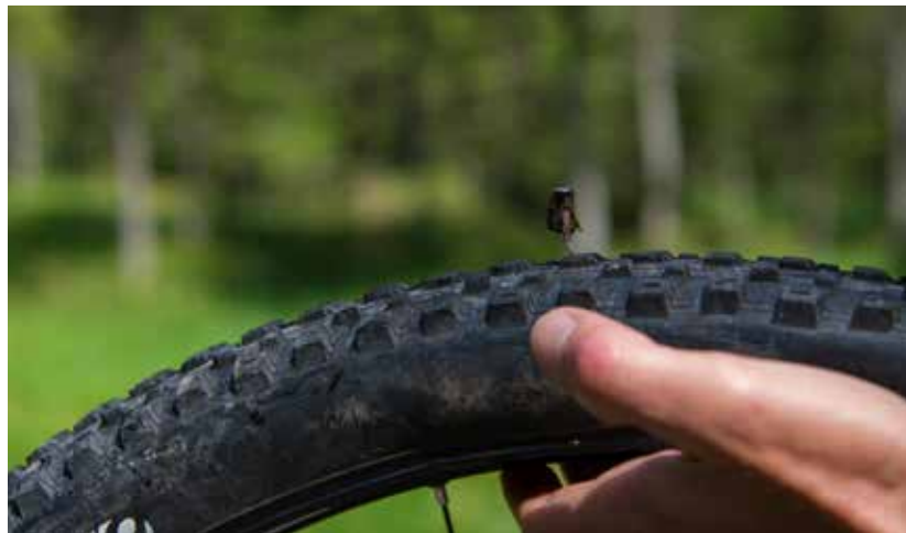
Souvenir uit de Eerste Wereldoorlog