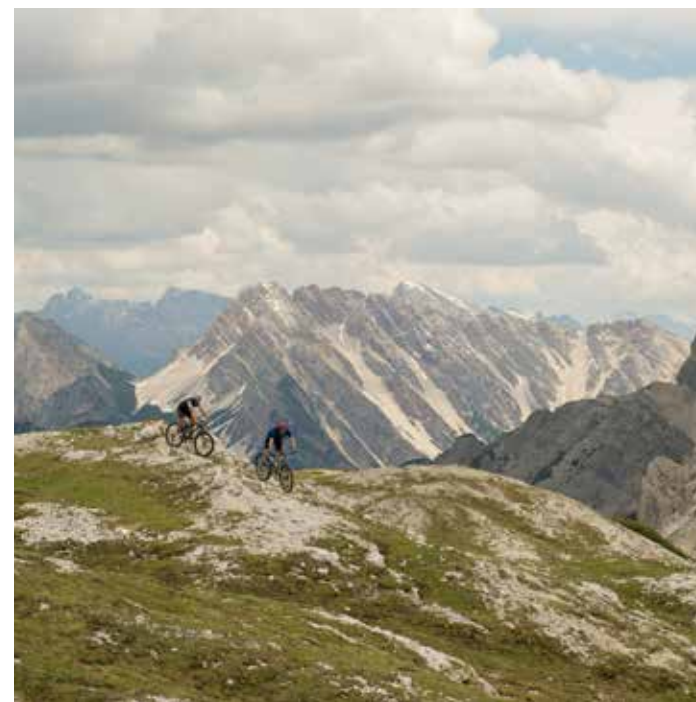
De Dolomieten zijn een speelplaats voor biker.