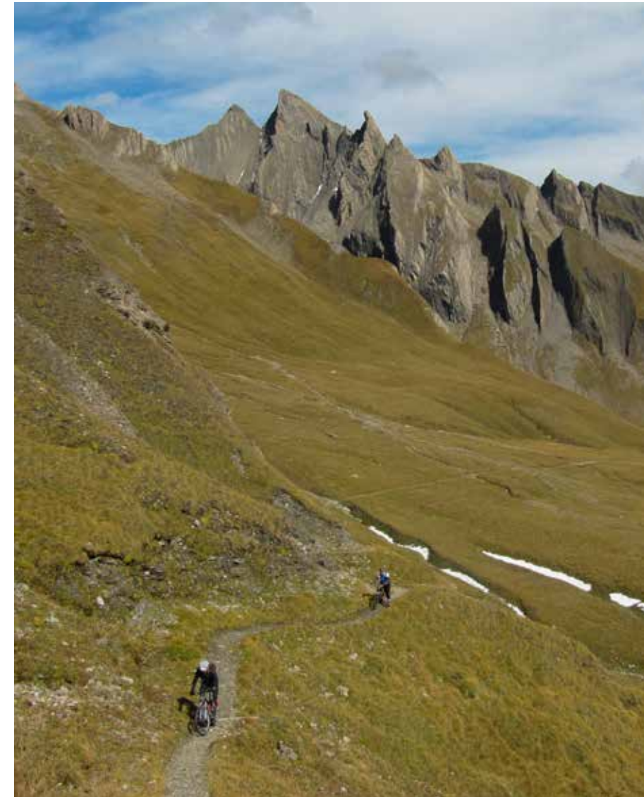
Zo ziet de Alpenkant er (bijna) zonder sneeuw uit.

Onze enige zekering is een roestige staaldraad langs een akelig diepe afgrond.