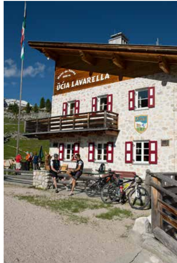
In de Lavarella-hut hebben we onze eerste overnachting.