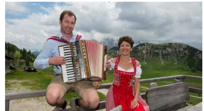
Muziek bij de lunch!

Onze enige zekering is een roestige staaldraad langs een akelig diepe afgrond.