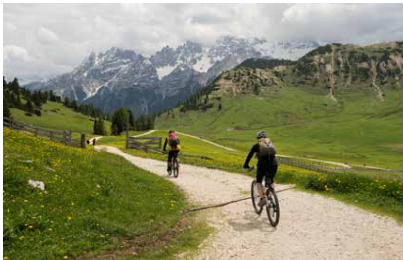
Bovenop de Plätzwiese met uitzicht op de Monte Cristallo