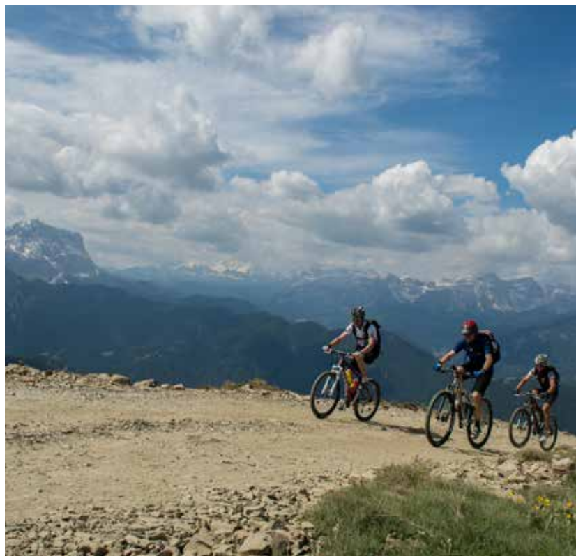
Op de top van de Kronplatz al meteen op de eerste dag fantastisch uitzicht.